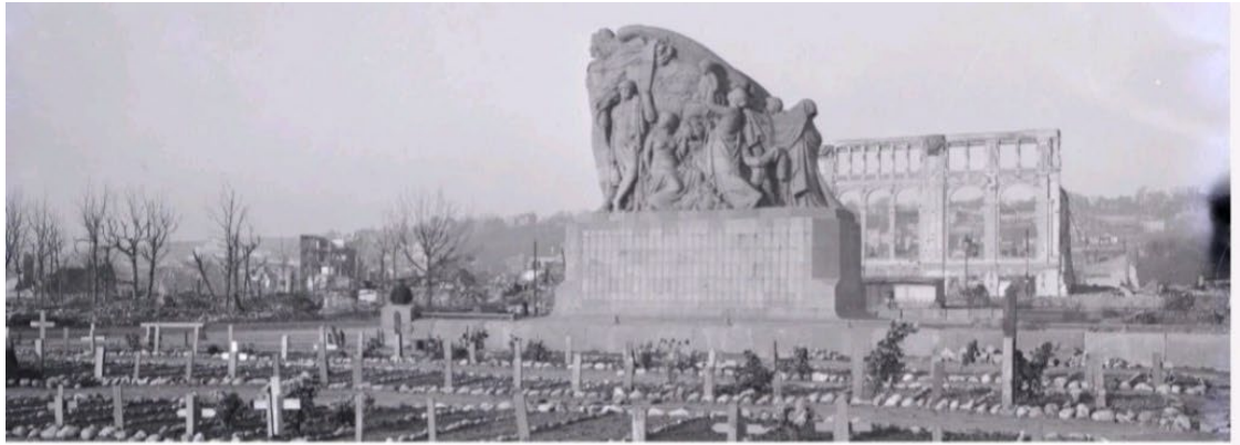
Tombes provisoires des victimes civiles des bombardements de septembre 1944 au pied du monument aux morts de la Première Guerre mondiale.